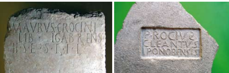
A la izquierda, epígrafe funerario romano de M. Crocini, natural de Igabrum (Cabra). A la derecha, sello de P. Rocivs, natural de Iponoba (Cerro del Minguillar).

que los romanos llamaron Salsum , se ubicaron otros importantes núcleos urbanos: Iponoba (Cerro del Minguillar) y el Municipio Contributo Ipsense, luego Respublica (Cerro de la Aldea, junto al Cortijo de Izcar). De ellos se sabe que obtuvieron el estatuto de municipio con el emperador Vespasiano. Torreparedones también alcanzó gran importancia, pues sabemos que tuvo la categoría de colonia o municipio. El Museo cuenta con una gran cantidad de objetos cerámicos (destacan las piezas de terra sigillata , lucernas, terracotas) metálicos (amuletos fálicos, botones, fibulas, herramientas agrícolas, apliques decorativos, etc.), vidrio, etc. de época romana. Probablemente, la actual población de Baena surgiera en esta época. Junto al actual casco urbano debió existir un pequeño núcleo de población rural que sería propiedad de un tal Baius , del cual derivaría el actual topónimo.