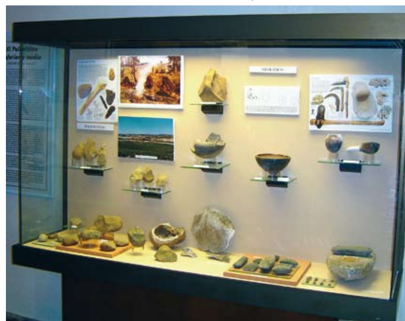
Vitrina dedicada a Paleolítico y Neolítico.

Baena cuenta con un abultado número de lugares de interés arqueológico que han deparado muestras significativas encuadrables en la cultura ibérica. Los grandes yacimientos del estilo de Izcar, Cerro del Minguillar, Torreparedones, Cerro de los Molinillos y Torre Morana, constituyeron verdaderos núcleos urbanos amurallados, cuyo grado de desarrollo cultural en la época ibérica puede intuirse admirando la originalidad y belleza de diversas obras de arte, de entre las que destacan las esculturas de leones.