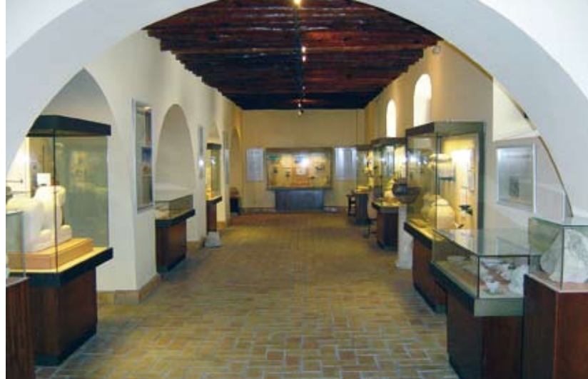
Panorámica de una de las salas.

La segunda vitrina está dedicada a estos dos períodos de la Pre-