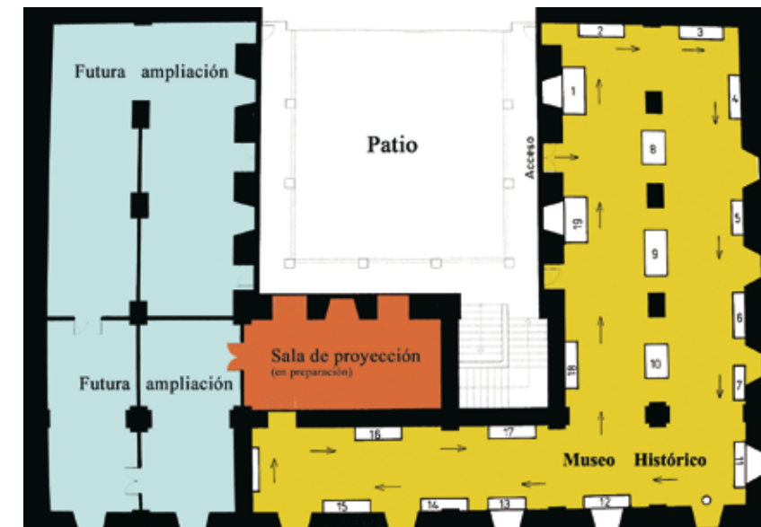
Plano del Museo.

El Museo nace con un marcado carácter didáctico y pretende ser un medio vivo de aprender Historia. No cabe duda de que su principal objetivo será conseguir que éste se convierta en un centro dinamizador desde donde se gestionen, a nivel de las competencias locales, aquellos programas relacionados con los bienes culturales de carácter histórico y arqueológico, entendiéndose que éste es el mejor camino para abordar con el mayor éxito posible la responsabilidad que la propia Ley de Patrimonio Histórico Español (Ley 16/1985), en su art. 7º, deposita en los Ayuntamientos.