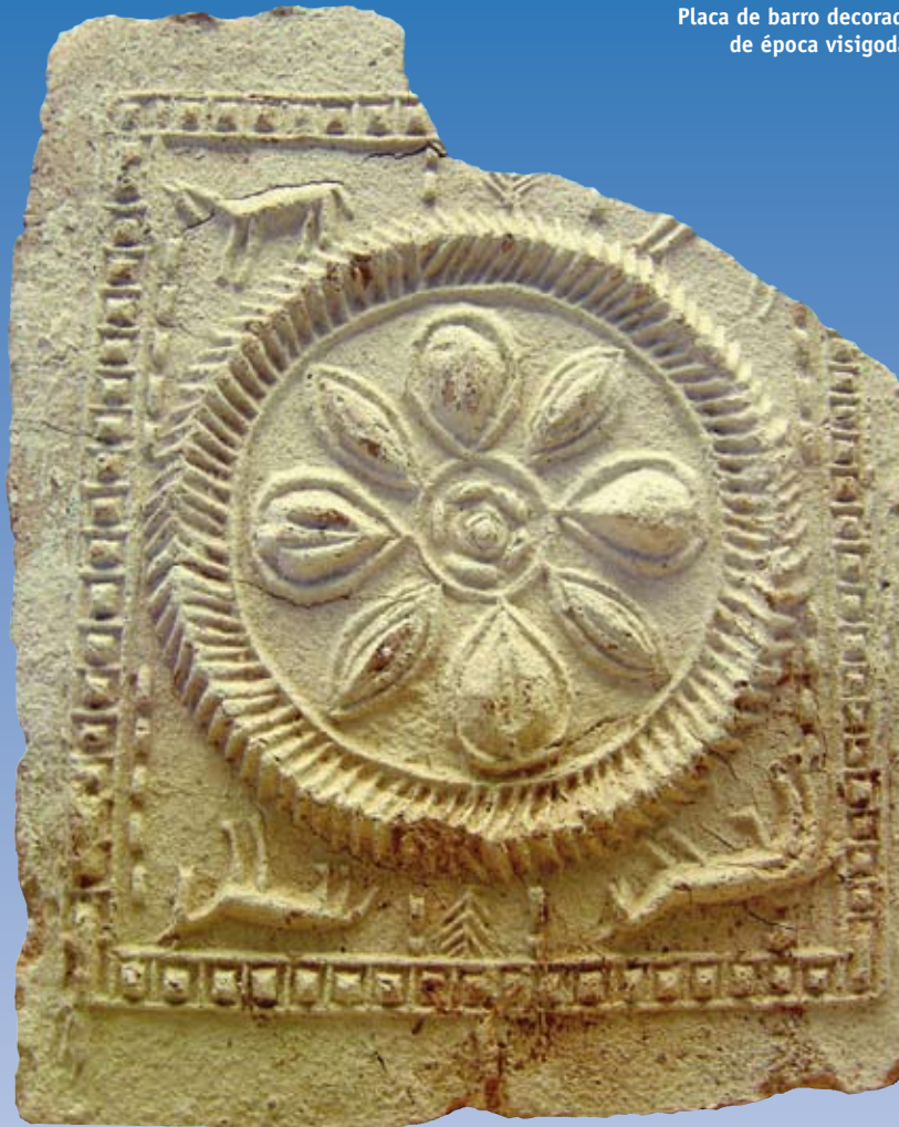
Placa de barro decorada de época visigoda.