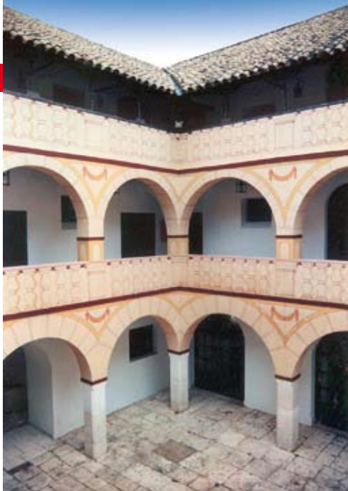
Patio de la Casa de la Tercia, en cuya planta primera se localiza el Museo.

El Museo está instalado en la planta primera de la Casa de la Tercia, situada en el nº 7 de la C/ Beato Fray Domingo de Henares. Como todas las tercias fue, indudablemente, de fundación eclesiástica, destinada a reunir la parte de los diezmos eclesiásticos y demás rentas correspondientes a la Corona. Iniciadas las obras en el año 1792 éstas concluyeron en 1795, según una inscripción que existía al fondo del patio central. En el año 1841 la supresión definitiva de las rentas pagadas a la Iglesia, tras la Desamortización de Mendizábal, hizo desaparecer el uso previsto para el edificio, que pasó a propiedad particular. A comienzos del siglo XX se adaptó y usó como posada y durante la guerra civil entre 1936-1939 se utilizó como cárcel.