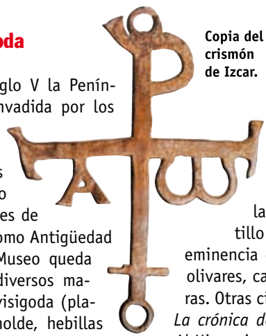
Copia del crismón de Izcar.

Las primeras noticias de Baena en la Alta Edad Media datan del año 899 con motivo de la rebelión de Omar ben Hafsun , año en el que se apoderó del lugar como paso previo a la conquista de Córdoba. La Baena árabe se denominó Bayyana según la cita del historiador cordobés Ibn