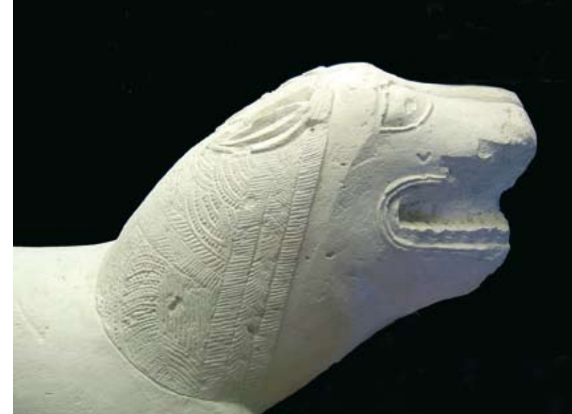
Detalle de la cabeza del león ibérico del Cerro del Minguillar.

La cultura material se enriquece de forma notable con aportaciones como la escritura, la metalurgia del hierro y la introducción del torno de alfarero que va a suponer una auténtica revolución al poder fabricarse una cerámica de mayor belleza y calidad. En su mayoría son cerámicas a torno grises y con decoración