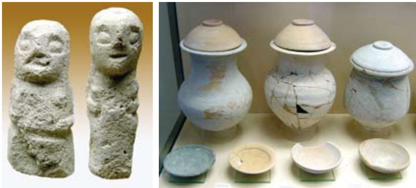
Exvotos ibéricos del santuario de Torreparedones (izquierda). Urnas funerarias y cuencos de época ibérica (derecha).