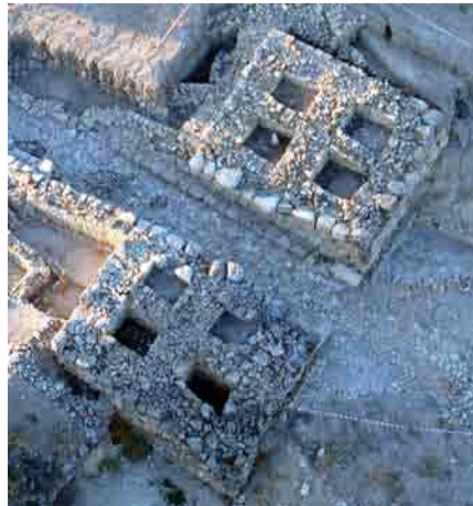
Panorámica aérea de la puerta oriental

musealización se colocarán réplicas de la columna sacra, altares y algunos exvotos. El objetivo final pretende la reintegración espacial del edificio sacro con la mínima intervención, de manera que permita la comprensión volumétrica al visitante, al tiempo que se protegen los muros interiores y pavimentos de la intemperie.