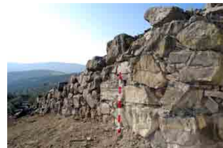
Estado final de un tramo de la muralla oriental tras los trabajos de limpieza.